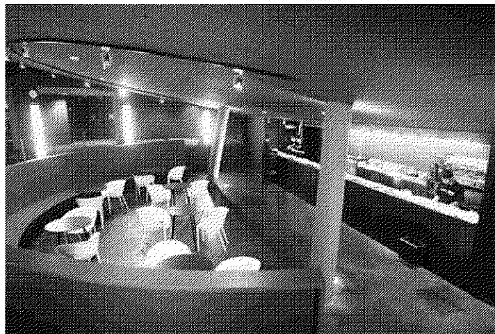
A dalt, un detall dels camerinos. Al mig, la façana noble i l'uniforme de Toni Mir3 per als acomodadors de la sala i, a baix, el foyer.

sat molta cura perquè compleixin la seva funci3. També molt d'ara, pe-